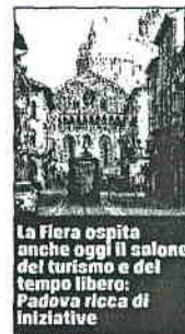
La Fiera ospita anche oggi il salone del turismo e del tempo libero: Padova ricca di iniziative