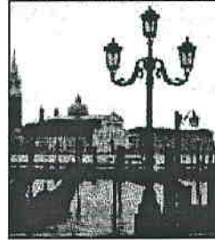
Male, ma non troppo L'Italia resta una meta ambita

Pur perdendo punti di fatturato rispetto al 2008, il turismo ha tenuto più degli altri settori. I dati disponibili dimostrano che l'export totale italiano ha perso circa il 25% ma le entrate da viaggiatori internazionali verso l'Italia sono calate molto meno (il 7,9%). Il divario è ben maggiore in Veneto dove il calo dell'export è del 20% contro il 5% del turismo estero e in Emilia Romagna con