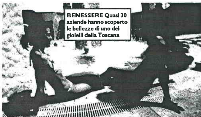
BENESSERE Quasi 30 aziende hanno scoperto le bellezze di uno dei gioielli della Toscana